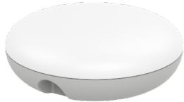
ASUS Lyra Care 搭載 ORIGIN™人工智慧無線感測技術